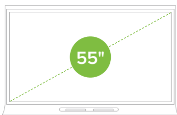
SMART Board 6055

Bénéficiez de toute la flexibilité nécessaire pour équiper vos salles de classe et vos environnements de collaboration de la manière la plus adaptée. Des points de fixation pour les mini PC sont disponibles.